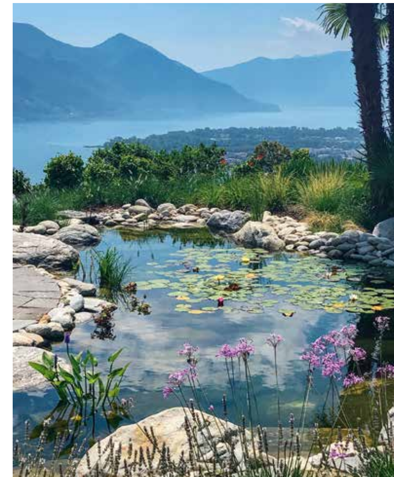
Dem Spa vorgelagert ist ein herrlich angelegter Garten mit Biotop. Von hier ist der Blick ins Tal schlicht sagenhaft.

Gefunden haben wir eine 20-jährige Ruine: Ein Physiker wollte mit seiner Frau eine Klinik bauen. Im untersten Geschoss hatte er sein Labor erschaffen, wo er auch einige Jahre tätig war. Oben hätten Zimmer und Behandlungsräume entstehen sollen. Leider ist er verstorben und so konnte das Projekt nie fertig gestellt werden. Als seine Frau ebenfalls verstarb, konnten wir das Grundstück mit der Ruine zwei Jahre nach der Entdeckung endlich erwerben. Und so durften wir 25 Jahre später die Geschichte an diesem Ort weiter schreiben und Ende März 2019 das Chiva Sun eröffnen. Die Geschichte ist jedoch nicht zu Ende, die Erweiterung auf dem angrenzenden Land ist bereits in der Planung.