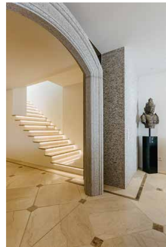
Der Türbogen im Eingangsbereich besteht aus Ivagna-Gneis, die Treppe führt hinauf in die privaten Bereiche.

Die Lage! Ein nach Süden ausgerichtetes Plateau in dieser Grösse mit einem freien 180-Grad-Blick von der Leventina-Ebene bis nach Italien ist eine Rarität. Und dazu der angrenzende Wald mit Bachtobel, Lagune und Wasserfall – schlicht einzigartig.