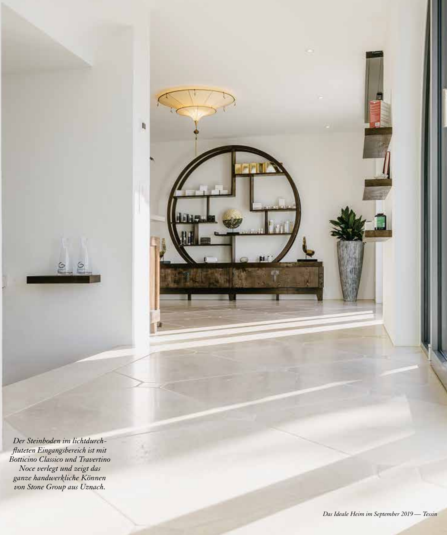
Der Steinboden im lichtdurchfluteten Eingangsbereich ist mit Botticino Classico und Travertino Noce verlegt und zeigt das ganze handwerkliche Können von Stone Group aus Uznach.