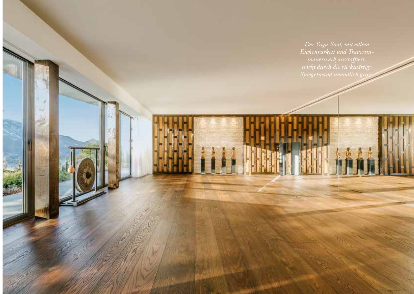
Der Yoga-Saal, mit edlem Eichenparkett und Travertinmauerwerk ausgestattet, wirkt durch die rückwärtige Spiegelwand unendlich gross.